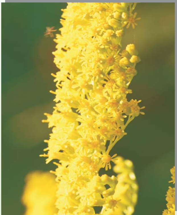
Blüte der Kanadischen Goldrute

[a] Kanadische Goldrute ( Solidago canadensis ), [b] Riesen-Goldrute ( Solidago gigantea )