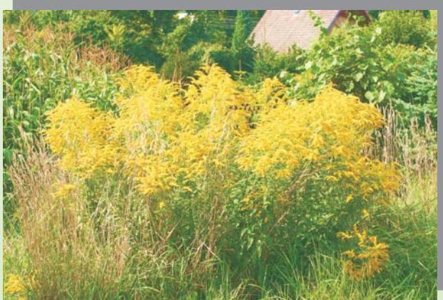
Bestand der kanadischen Goldrute

Aus den Blüten der Goldruten entwickeln sich zahlreiche flugfähige Samen, die mit dem Wind weit verbreitet werden. Die Goldruten können sich außerdem über regenerationsfähige Rhizomfragmente ausbreiten, die z. B. mit fließendem Wasser oder Gartenabfällen transportiert werden.